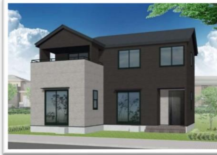
【3号棟イメージパース】

土地面積: 188.99㎡ (57.16坪) 建物面積: 111.79㎡ (33.81坪) 4LDK+小屋裏収納